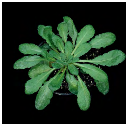
Die Ackerschmalwand ( Arabidopsis thaliana ) ist das Modellgewächs der Pflanzengenetiker schlechthin. Selbst eine so unscheinbare Pflanze enthält Tausende unterschiedlicher Stoffwechselprodukte. Dazu zählen auch Fettmoleküle. Diese können auf Basis ihrer chemischen Eigenschaften sortiert werden (rechts). Jedes Farbpixel entspricht dabei einem bestimmten Molekültyp.

Die Depressionstherapie könnte ebenfalls ein gemeinsames Projekt von Metasysx und Charité werden. „Noch immer diagnostizieren Mediziner die Erkrankung im Wesentlichen über die